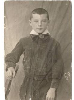
grand-mère Rabillat et mémé Péo

Nous les tenons à la disposition de leur propriétaire.